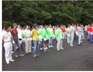
毎度お馴染みの緑のユニフォームです。

やはり捨てる人も「罪悪感」を感じながら捨てているのでしょうか。こういった行為を見つけたときには一言注意を促し、また捨てる人も自分に問い掛けてもらいたいと思います。