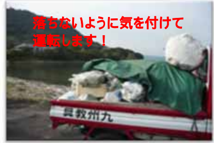
落ちないように気を付けて 運転します！