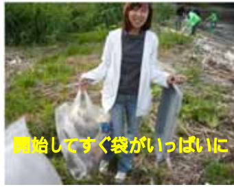
開始してすぐ袋がいっぱいに！