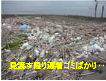
見渡す限り漂着ゴミばかり...