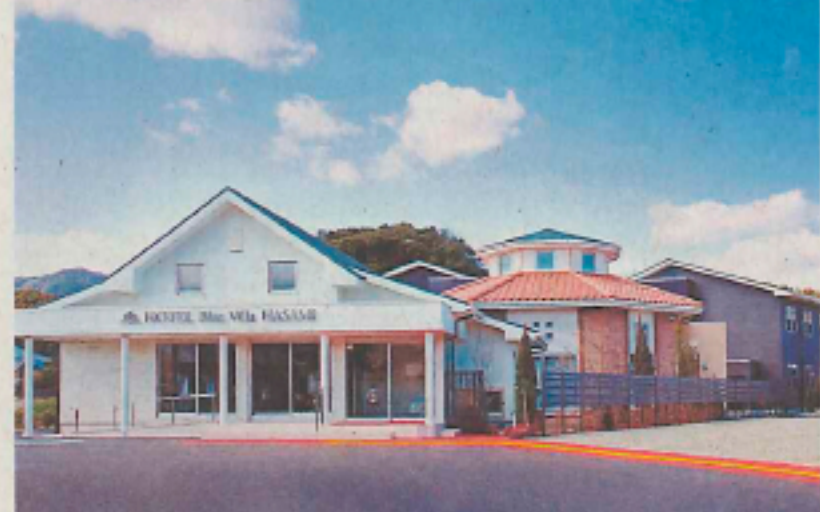
ホテルプリスヴィラ波佐見

した。「形式知」重視の単一的価値観から、「暗黙知」重視の多様な性へパラダイムシフトしたのです。転換期の96年、当社は、「二歩先行く企業」の在り方を探ろうと、それまで一切経験がなかったホテル事業に進出しました。やがてホテルで培ったサービスのノウハウは、各種メーカーのマルチベンダーとしての立ち位置をさらに強め、「業界」という「経済の時代」