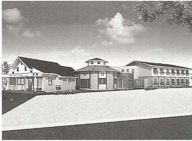
ホテルの完成予想図(九州教員提供)